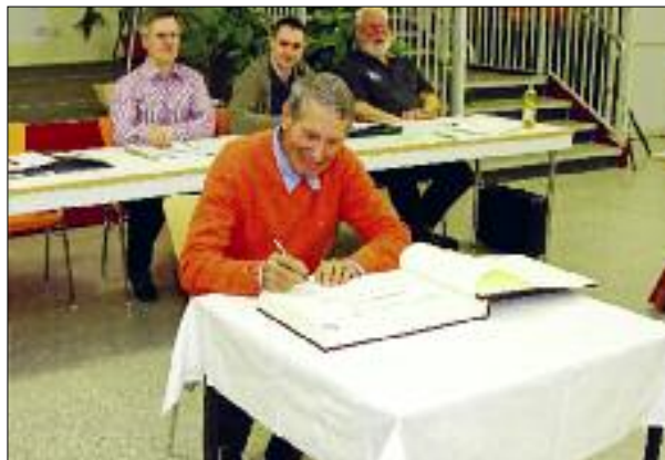
Radsportlegende Dieter Wiedemann trägt sich während der Stadtratssitzung in das Ehrenbuch der Stadt Flöha ein.

Zur Sitzung des Stadtrates Flöha am 29. Januar 2015 wurde nunmehr Dieter Wiedemann in das Ehrenbuch der Stadt Flöha eingetragen. □