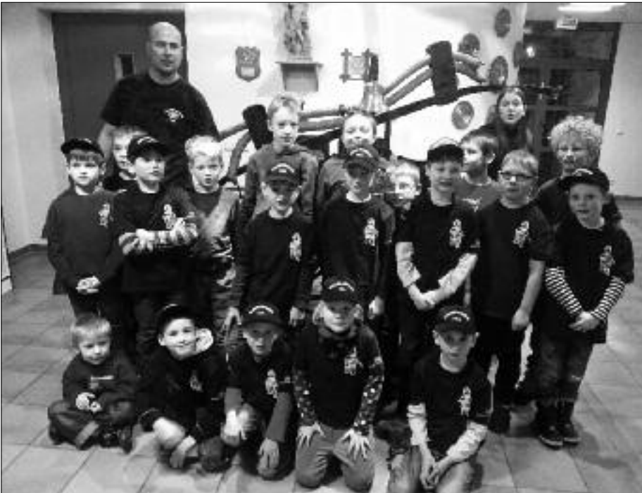
Schon ganz schön schlagkräftig: Die Mädchen und Jungen der Babinifuerwehr Flöha.